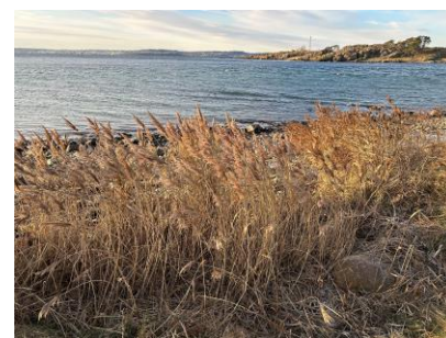
Vinter ved fjorden