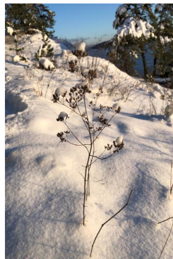
Lysere tider i vente