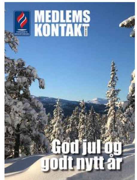
Medlemskontakt nr. 4/2023