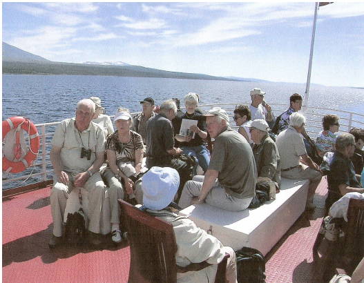
Sommertur på Femunden 2006 Vi nyter sommeren på dekk