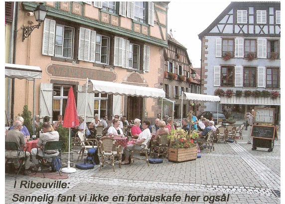
Høsttur Bodensjøen – Alsace 2006