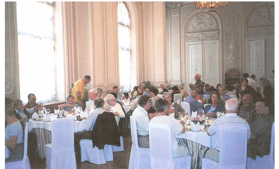
St. Petersburg 2004 Lunch i Vinterpalasset