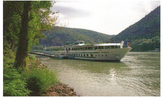
Høstcruise på Donau 2007