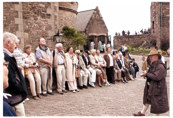
Høsttur til Orknøyene – Skottland 2008 Sightseeing Edinburgh Castle