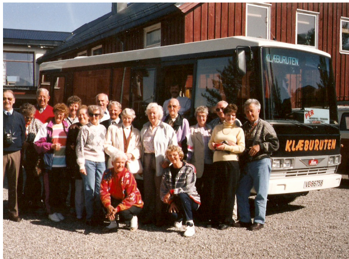
Espedal Fjellstue 1993