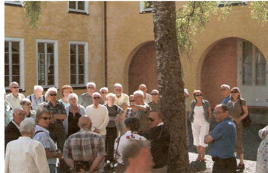
Sommertur til Falstad – Tautra 2007