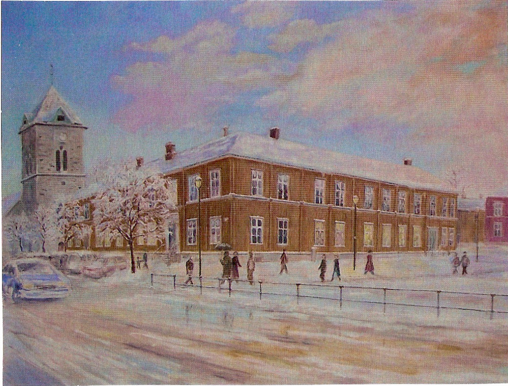
Hornemansgården – Vår møteplass!