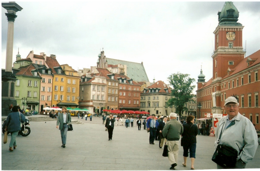
Polen: Krakow – Warszawa 2003 Gamlebyen i Warszawa