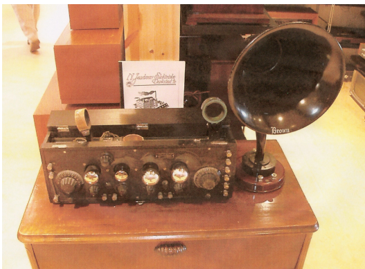
Sommertur Vekstarstua 2008 Radiomusset Selbu